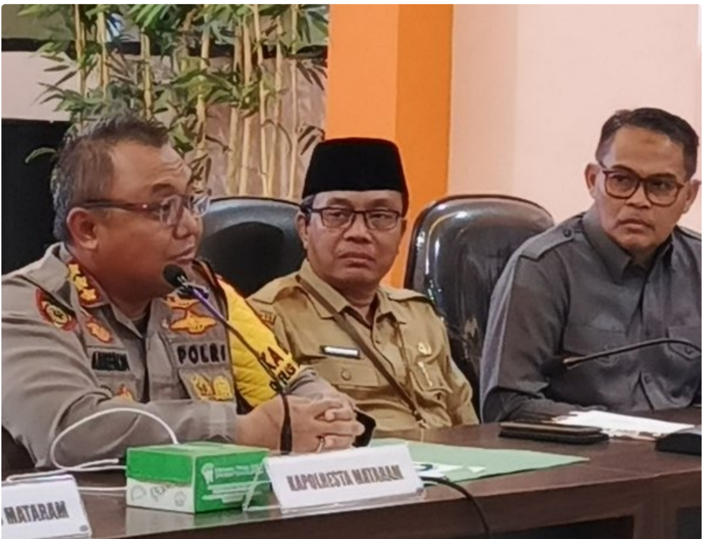
Kapolresta Mataram (Kiri) saat memimpin Konferensi pers akhir tahun, Selagi (31/12/2024)